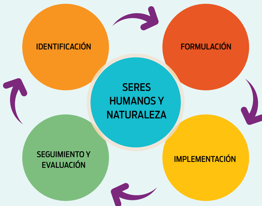
Figura 1. Ciclo de la política pública