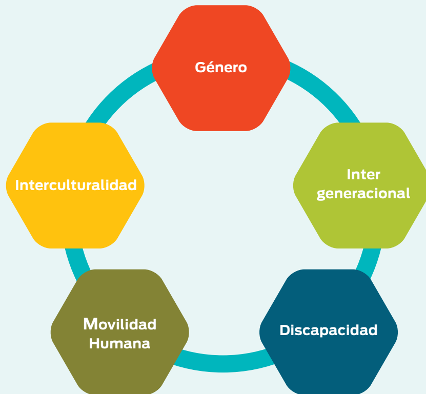
Figura 2. Enfoques de igualdad